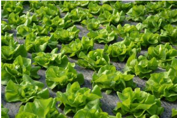
lattuga cappuccina prime fasi