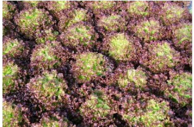
lattuga lollo rossa